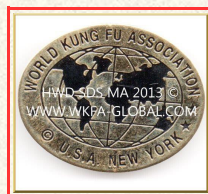
Damalige W.K.F.A USA

Globalisierung ist von einander lernen und richtig zu verstehen.