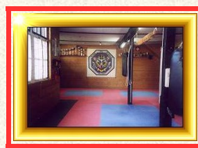
SAKEV Dojo seit 01.Mai 1979 in Olten, Wilerweg 28 Dies war 39 Jahre mein Kung-Fu Trainings Kampfsport zu hause.