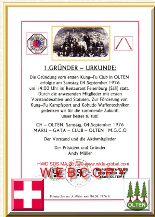
Damalige erste Gründerurkunde vom 04.September 1976 in OLTEN